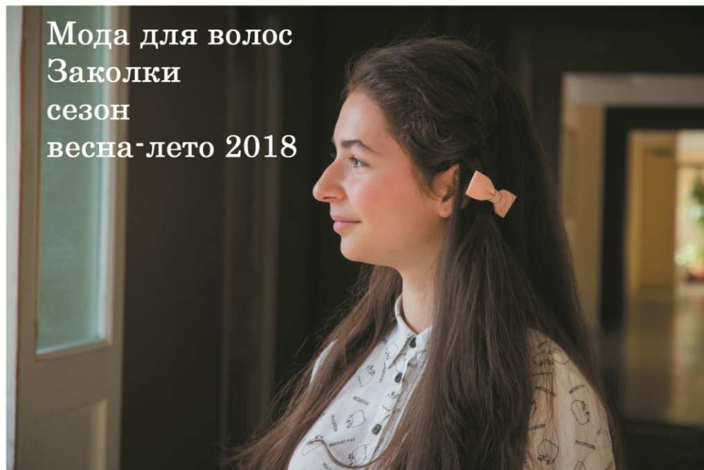
Мода для волос Заколки сезон весна-лето 2018

Безусловно, заколка вещь необходимая, как в практических целях, для удобства, так и в целях бижутерии или аксессуара, чисто для красоты. Самые простейшие, аккуратные чёрно-белые заколки, вписывающиеся в любую причёску, и подходящие даже под самый строгий стиль одежды. Они изысканные, утончённые и главное – очень