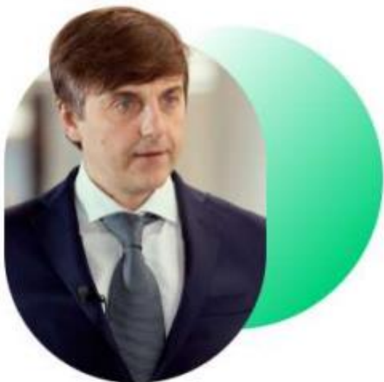
Кравцов Сергей Сергеевич,

Министр просвещения Российской Федерации